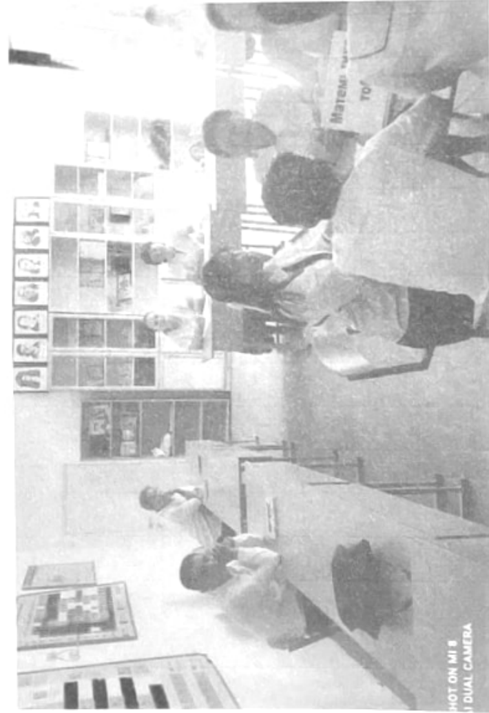
HOT ON MI 8 A DUAL CAMERA