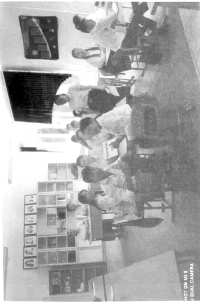
HOT ON MI 8 A DUAL CAMERA